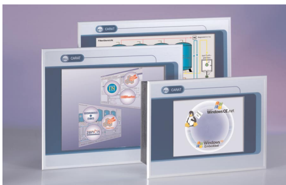
Embedded-Panels mit Touchscreen (verschiedene Displaygrößen)

Diese Systemlösungen ermöglichen dem Anwender ein kostengünstiges Steuerungs- und Visualisierungsprojekt zu implementieren, das zielgenau auf die jeweilige Anwendung zugeschnitten ist. Für spezielle Anforderungen sind kundenspezifische Hard- und Software-Erweiterungen möglich.