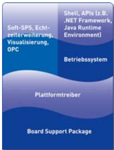
Vierstufiger, hierarchischer Aufbau von Windows Embedded Standard 2009

Mit Windows Embedded Standard ist das Design von dedizierten IPC-Systemen für komplett unterschiedliche Anforderungen möglich. Dank des modularen Systemaufbaus sind nur die notwendigen Komponenten, Treiber und Dienste integriert, sodass hardwareseitig auf energieeffiziente, lüfterlose System zurückgegriffen werden kann. Dabei muss der Software-Ingenieur nicht auf die gewohnte Windows-Programmier-systeme verzichten und kann sogar bestehende Anwendungen aufgrund der identischen Windows-API oder mittels .net-Framework-Integration auf dem Embedded System weiterverwenden.